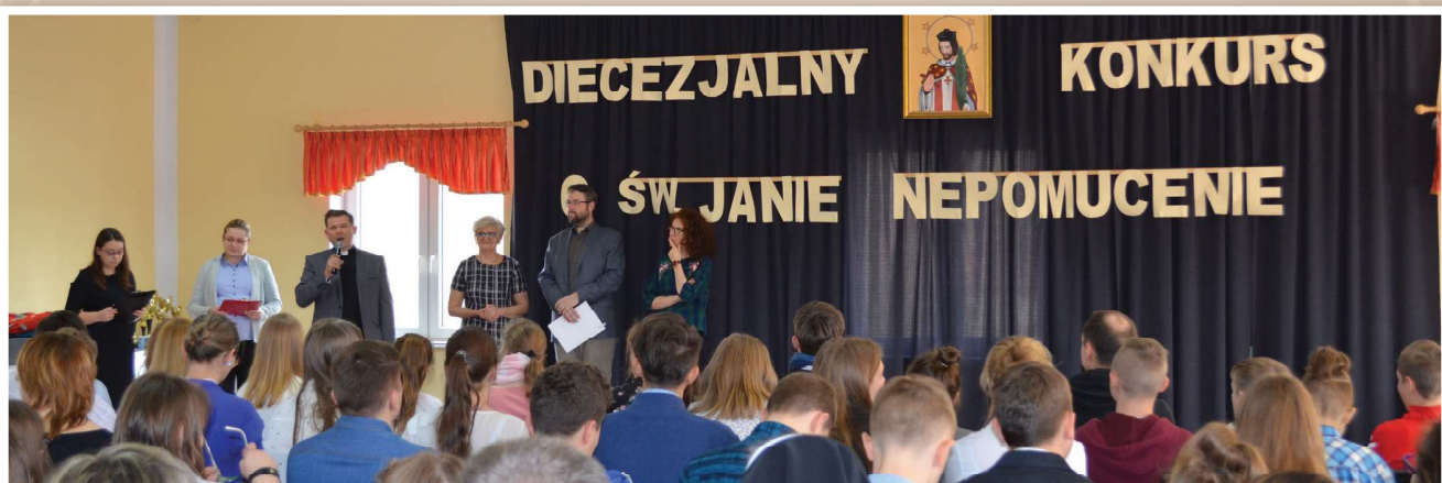
Fot. z archiwum parafii